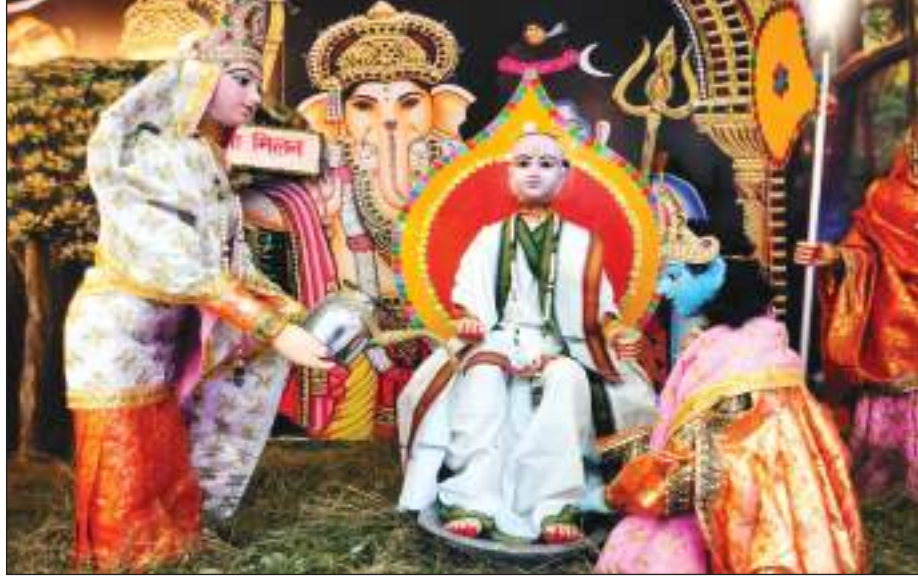
कानपुर में सनातन धर्म मंदिर में राधे कृष्ण की झांकियां सजाई गईं।

विवादित बयान आचार्य ने स्टालिन का सिर कलम करने वाले को 10 करोड़ रुपये का इनाम देने की घोषणा भी कर चुके हैं