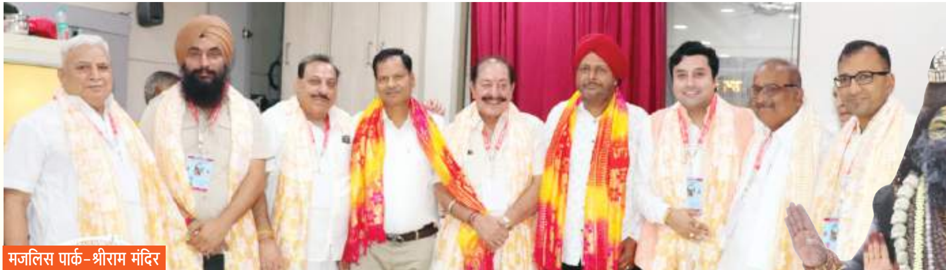
मजलिस पार्क-श्रीराम मंदिर